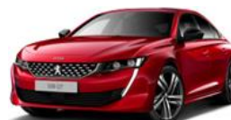
Peugeot 508 II