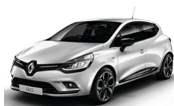
Renault Clio IV