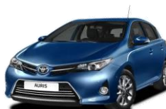
Toyota Auris II