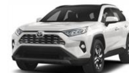
Toyota Rav4 V

Source : Rapports d'expertise pour les sinistres de vol (retrouvés ou non) déclarés en 2022, véhicules de moins de 10 ans