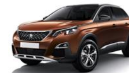
Peugeot 3008 II